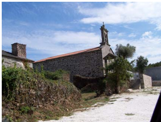
Igrexa de Bando