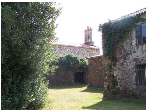
Conxunto etnográfico en Bando