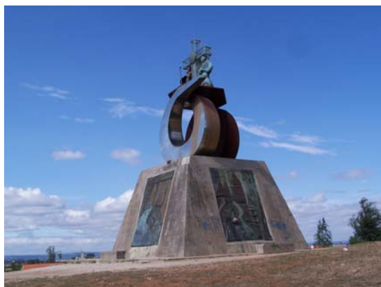
Monte do Gozo